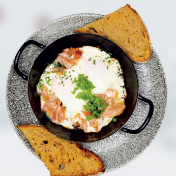
Ham & Eggs