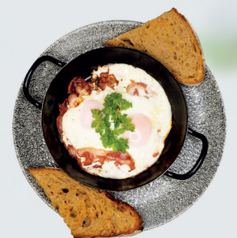
Bacon & Eggs mit geräucherterem Speck